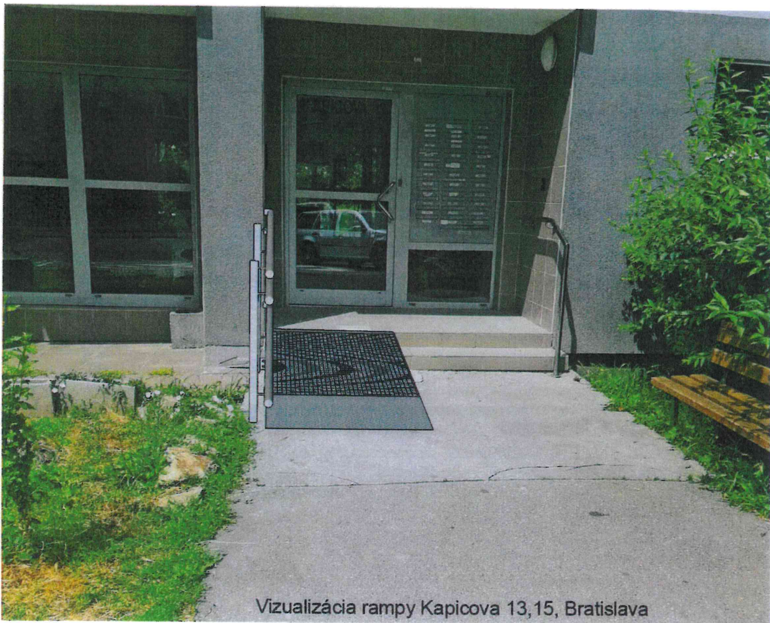
Vizualizácia rampy Kapicova 13,15, Bratislava