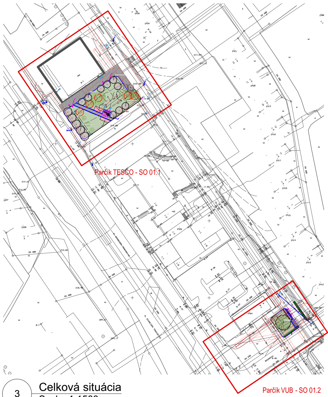
3 Celková situácia Scale: 1:1500