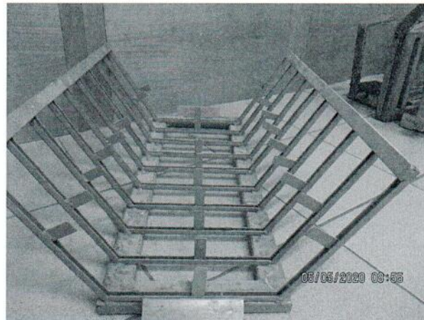
ilustračný záber obr.6