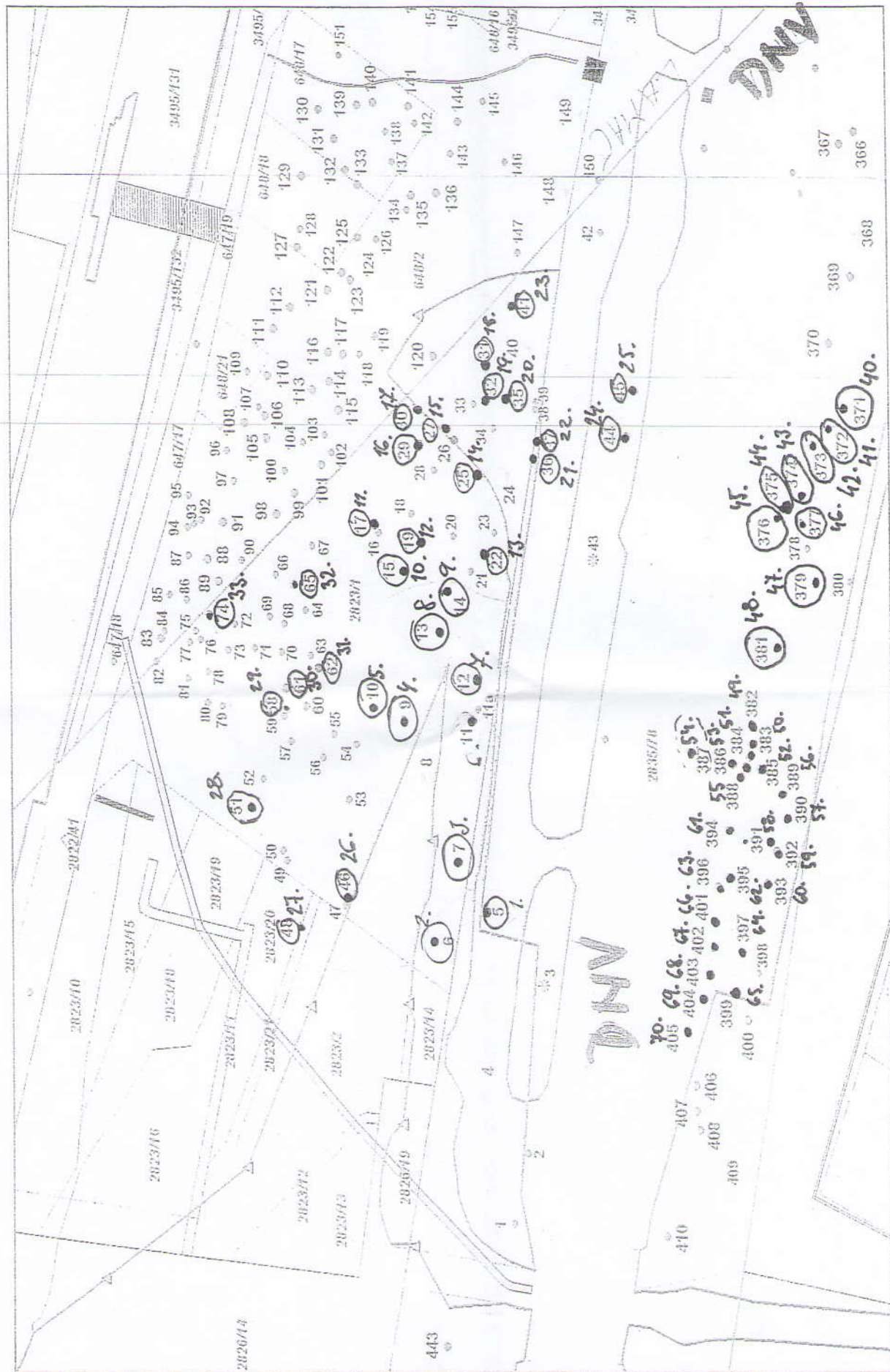
Obr. 3 Bratislava – Devínska Nová Ves, Dúbravka a Lamač – Predĺženie Saratovskej – výskyt drevin v dotknutom území – časť 2