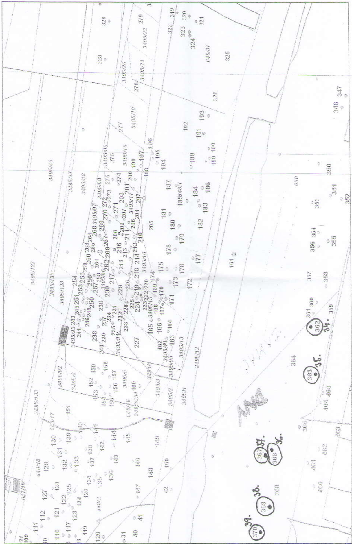
Obr. 4 Bratislava – Devínska Nová Ves, Dúbravka a Lamač – Predĺženie Saratovskej – výskyt drevín v dotknutom území – časť 3