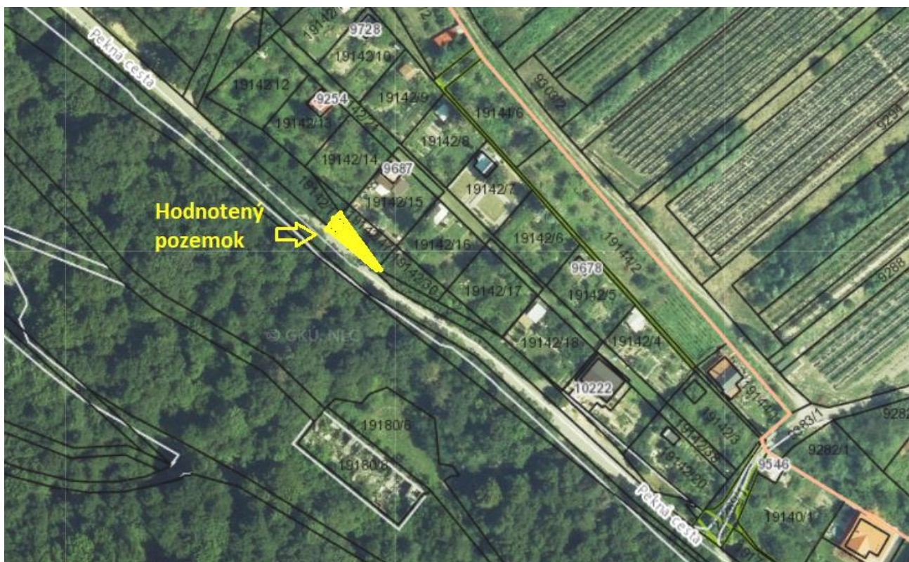
Vyznačenie umiestnenia nehnuteľnosti