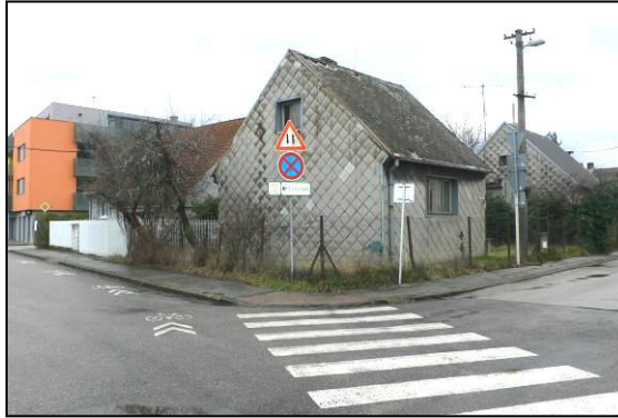
spojnica ulíc-Pluhová a Pri Dynamitke