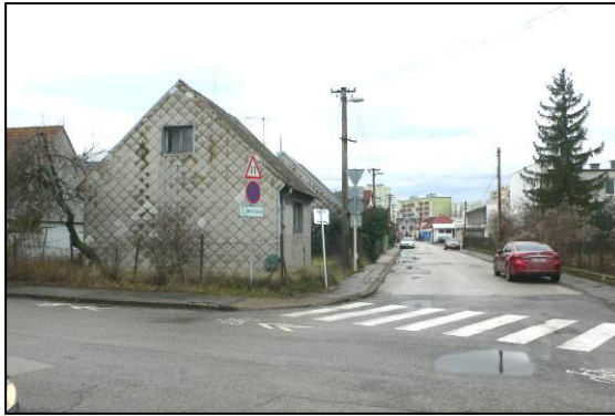
vpravo od domu-ul.Pri Dynamitke