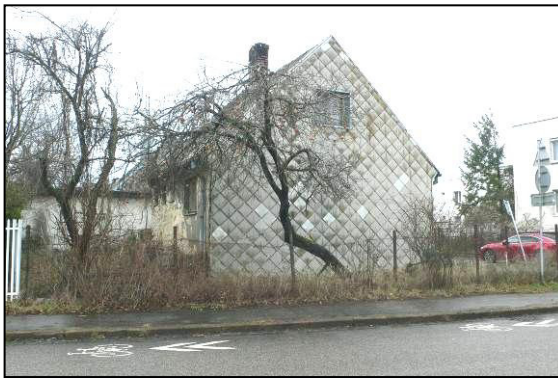
pozemok parc.č.12930/1 s rodinným domom s.č.847