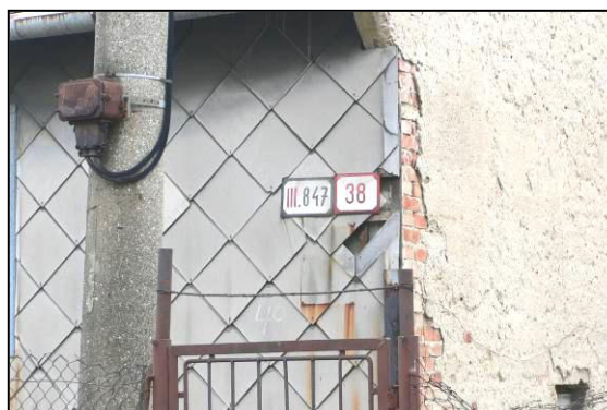
súpisné a popisné číslo domu