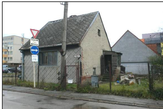
pohľad na pozemok a dom z ul.Pri Dynamitke