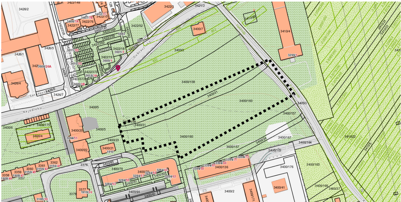
Mapa širšieho územia s označením polohy pozemku parc. č. 3400/160

Pozemok parc. č. 3400/160 priamo ohraničujú zo severozápadnej strany pozemok vo vlastníctve fyzickej osoby, z juhovýchodnej strany pozemky vo vlastníctve hlavného mesta SR Bratislavy, zo severovýchodnej strany miestna asfaltová komunikácia- ulica Agátová, z juhovýchodnej strany bytový dom. V priamom okolí sa nachádzajú zo severnej strany nezastavané pozemky, z východnej nezastavané pozemky- záhradkárska oblasť a vzdušnou čiarou vo vzdialenosti asi 350 sa nachádza stavba diaľnice D2“, z južnej až juhovýchodnej strany novostavba bytového domu a rozostavaná stavba s názvom „MAMAPAPA“, ktorý po dokončení bude podľa dostupných zdrojov obsahovať 115 bytov.