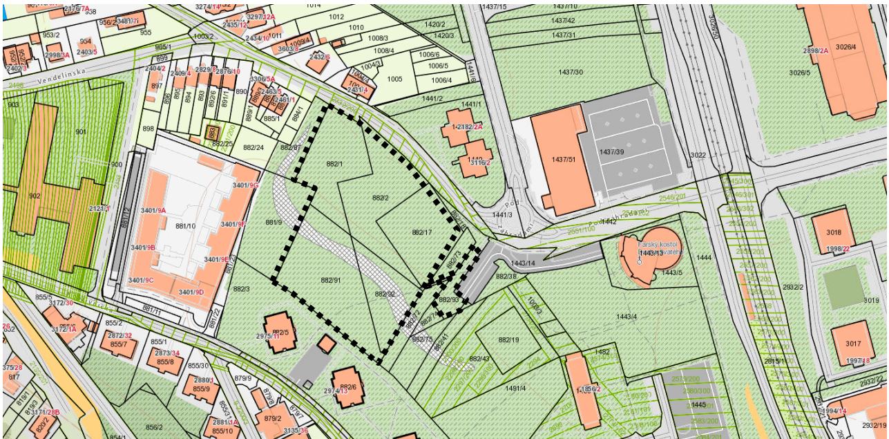
Mapa širšieho územia s označením polohy pozemkov parc. č. 882/1, /2, /17, /91, /92, /93

Dúbravka je mestská časť Bratislavy ležiaca na východnom úpätí Devínskej Kobyly. Počet obyvateľov sa pohybuje okolo 40000. Súčasťou mestskej časti sú miestne časti Krčace, Záluhy a Podvornice. Dúbravka vzhľadom na svoj počet obyvateľov neposkytuje príliš rozsiahlu infraštruktúru prevádzok poskytujúcich zábavu a uvoľnenie. Centrom kultúrneho diania je od roku 1986 Dom kultúry Dúbravka, v ktorom možno navštíviť kino alebo divadlo. V Dúbravke sú dva futbalové štadióny – FK CRA v Starej Dúbravke a ŠKP Dúbravka oproti Zimnému štadiónu. V súčasnosti v Dúbravke premávajú autobusy 20, 123, 23, 26, 35, 83, 84, N21, a električky 4 a 5 (zdroj: wikipedia.org).