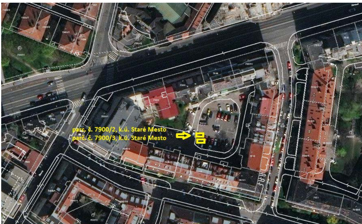
Vyznačenie umiestnenia nehnuteľnosti