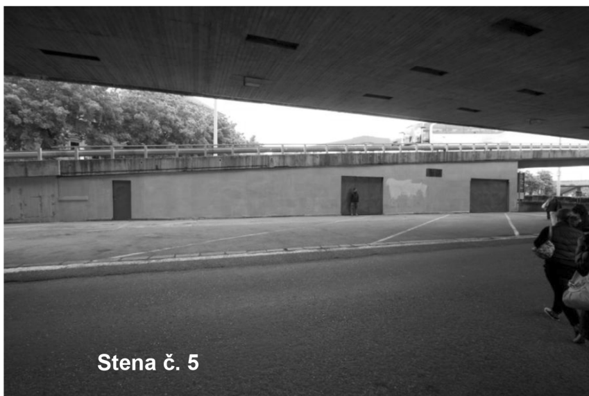
Stena č. 5