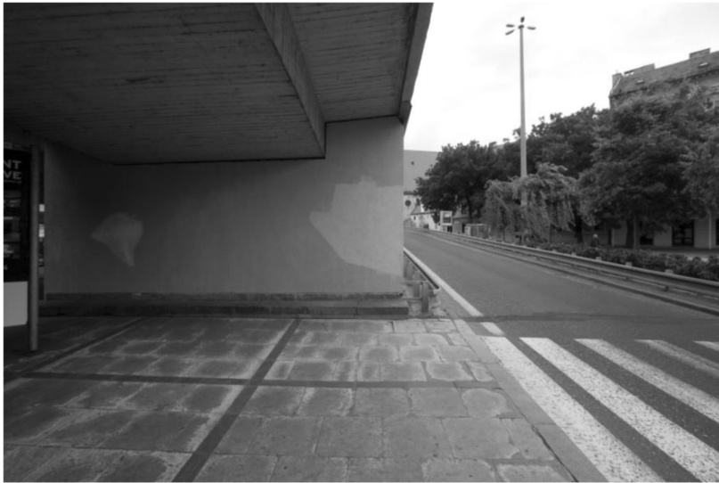
Stena č. 6