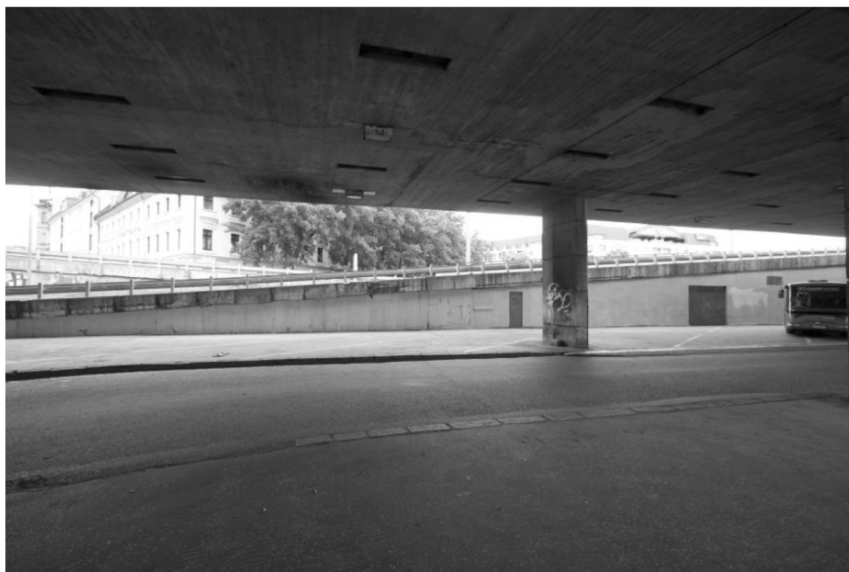
Stena č. 5