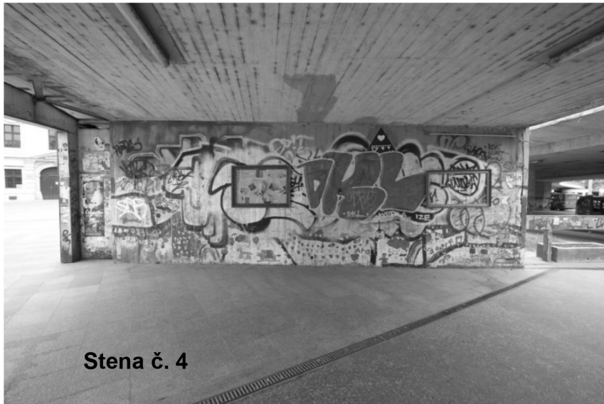
Stena č. 4