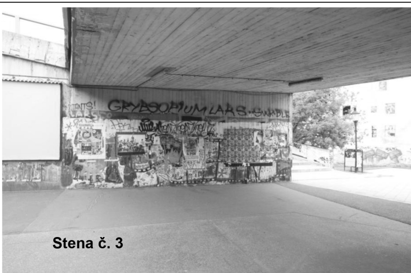
Stena č. 3