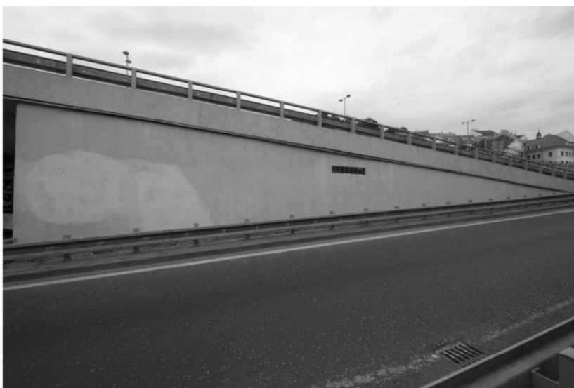
Stena č. 7