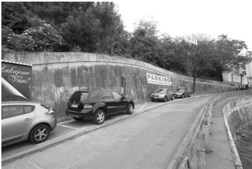
Stena č. 1