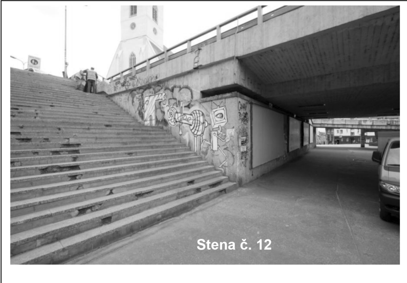
Stena č. 12