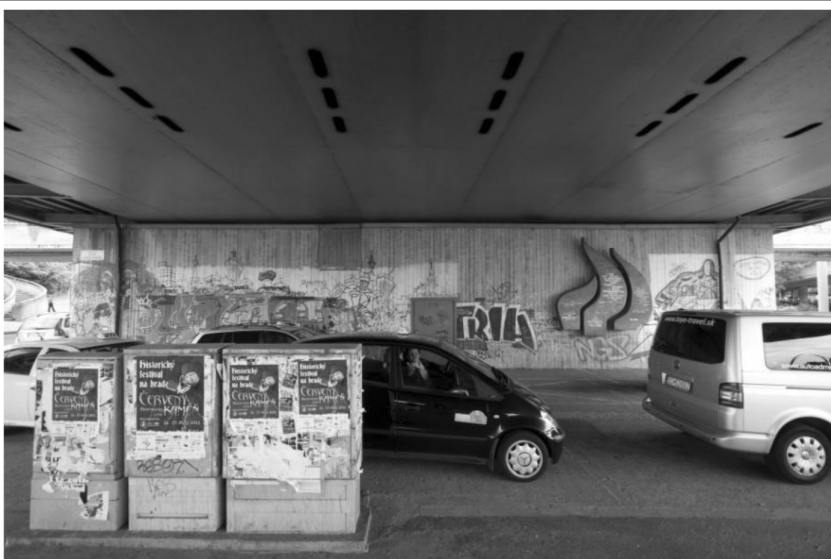
Stena č. 8