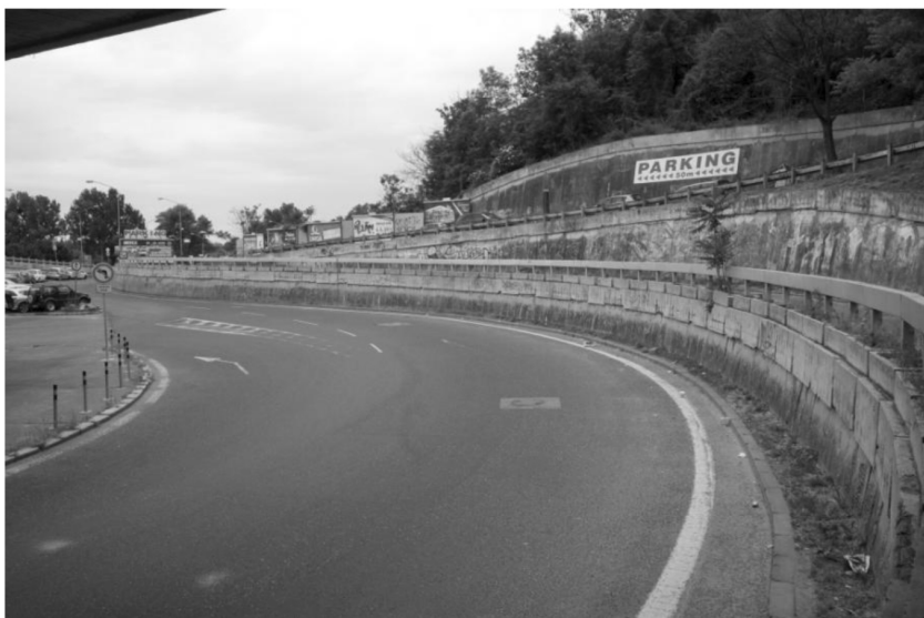
Stena č. 2