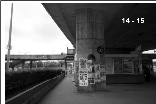
14 - 15